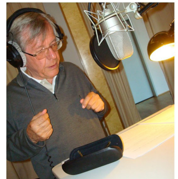
Mit Herbert Feuerstein in der Sprechrolle des Taktstockbauers