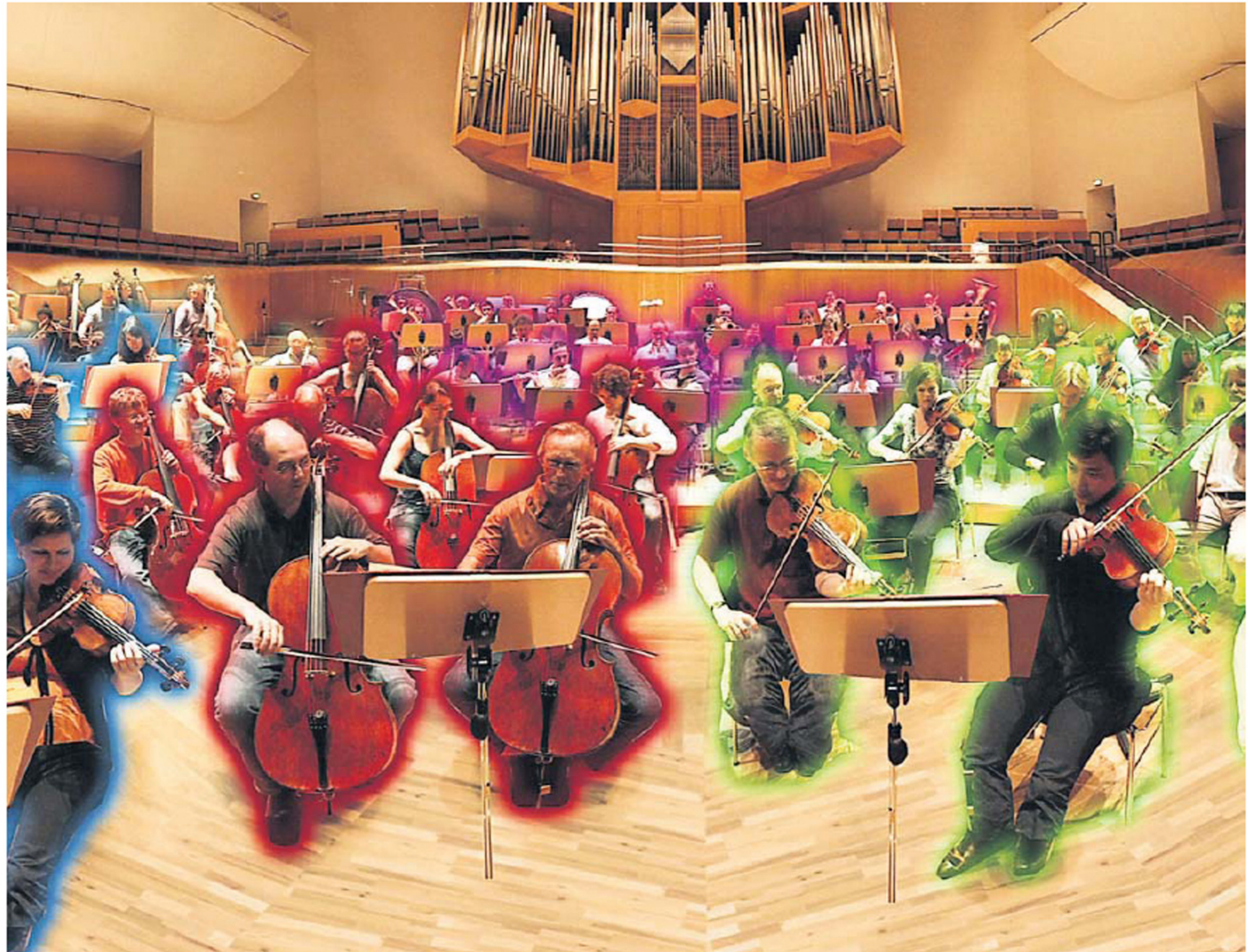
Spielt die violette Gruppe nicht gerade falsch? Oder die rote zu laut? Warum schaut die grüne nie zu mir? Und was machen die Blauen da eigentlich? Das sind Überlebensfragen für jeden guten Dirigenten.